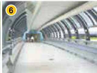
松下IMPビル入口 SKY WAY