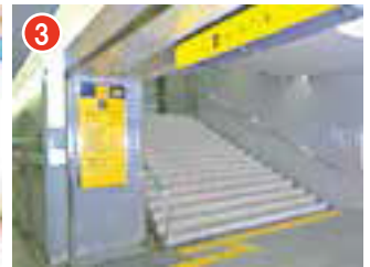
大阪ビジネスパーク駅 4番出口