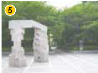
大阪ビジネスパーク円形ホール 入口